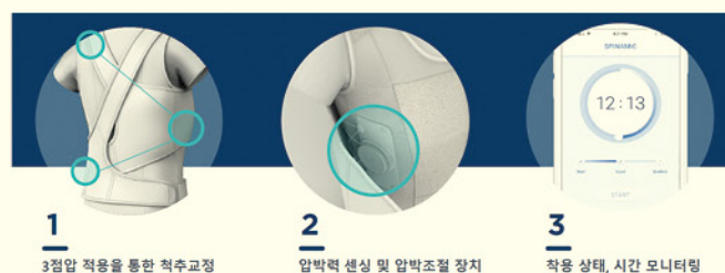
섬유기반 압력센서를 이용한 웨어러블 디바이스(척추교정기)